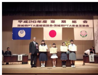
写真：茨城県 PTA 連絡協議会定期総会の表彰式の様子と受賞作